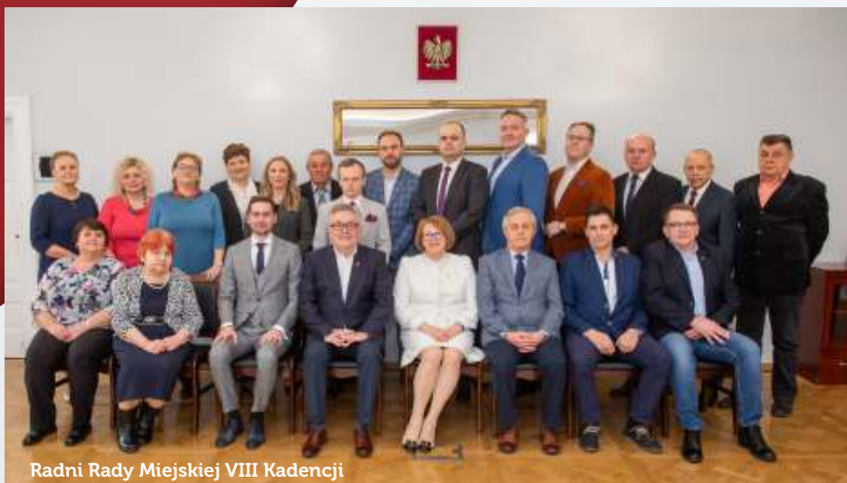
Radni Rady Miejskiej VIII Kadencji

Burmistrz Grodziska Mazowieckiego wraz z Radą Miejską