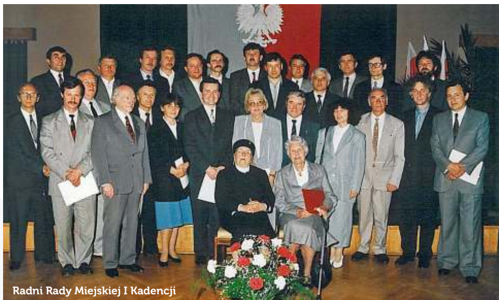
Radni Rady Miejskiej I Kadencji

- Widowisko słowno-muzyczne o historii Grodziska "500 plus czyli zgrany Grodzisk", godz. 19:00, Park Skarbków