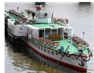
Viktória Lichvárová 5. ročník